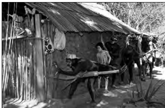
Imagen 1. Judíos acechando la casa del Cristo-Sol-Maíz, Judea de San Juan Diego, San Juan Bautista, Nayarit, 2010.

A diferencia de la cultura occidental, a la cual nuestra sociedad pertenece, en la mayoría de los pueblos indígenas hoy en día prevalece el pensamiento mítico, con el que se explican las preguntas esenciales de la vida: ¿De dónde venimos? ¿Cuándo comenzó el mundo? ¿Quién o cómo se crearon todas las cosas?, entre otras.