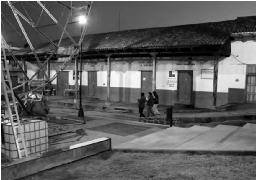
Imagen 3. Plaza principal de Zirahuén. Mayo de 2014. Berenice Granados.

La segunda etapa del proceso, denominada “procesamiento y almacenamiento”, se desarrolla parcialmente durante la estancia en campo: todas las noches, el material documentado de día se almacena y ordena en una computadora. Se trabaja durante la noche para hacer el vaciado de las tarjetas de memoria de las cámaras de video y de las cámaras fotográficas para que puedan utilizarse al día siguiente. Por cada día de campo, se hace una carpeta organizada en subcarpetas, una para cada dispositivo de grabación; a la carpeta se le asigna el modelo del medio, luego se vacían todos los clips. Se procede de la misma manera para materiales de audio, de video y fotografías.