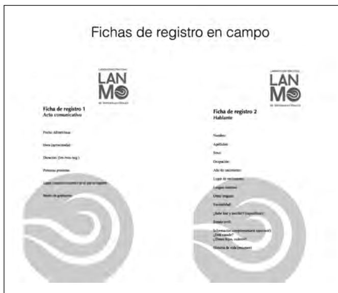
Imagen 2. Fichas de registro en campo.

La documentación de los materiales también implica la recopilación de datos contextuales asociados, ¿quién está al habla?, ¿dónde se documentó?, ¿cuándo?, ¿quién estaba presente? Son algunas interrogantes que no pueden faltar entre los datos consignados, esto es tanto los datos del acto comunicativo que se documenta, como los datos de los conversadores o las personas que hablan en ellos.