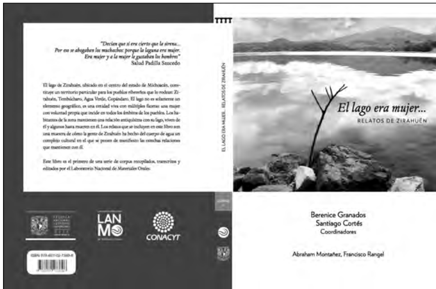
Imagen 5. Corpus. El lago era mujer... Relatos de Zirahuén .

El lago era mujer... Relatos de Zirahuén tiene como propósito poner en relación materiales orales en forma de texto escrito a disposición de un lector para ser leídos como literatura. El público al que está dirigido es bastante amplio, pues no sólo está destinado a especialistas, en realidad puede ser leído por cualquier persona