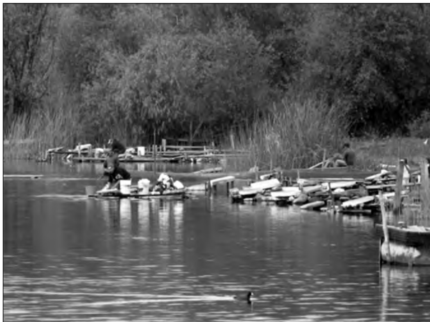
Imagen 4. Lavaderos. Granados, enero de 2013. Berenice Granados.

Una vez que se regresa de campo, se revisan las carpetas y cada uno de los materiales es renombrado y clasificado. Para generar los nombres de los archivos, hay que especificar los siguientes datos, en el siguiente orden: estado.localidad.aaaa.mm.dd.modo.tipo.contexto.especificación.medio de grabación.formato .