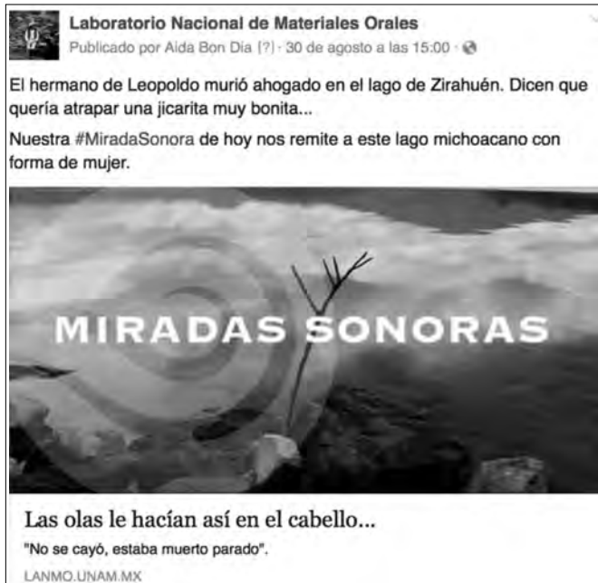
Imagen 6. “Miradas Sonoras” en Facebook. LANMO, 2016.