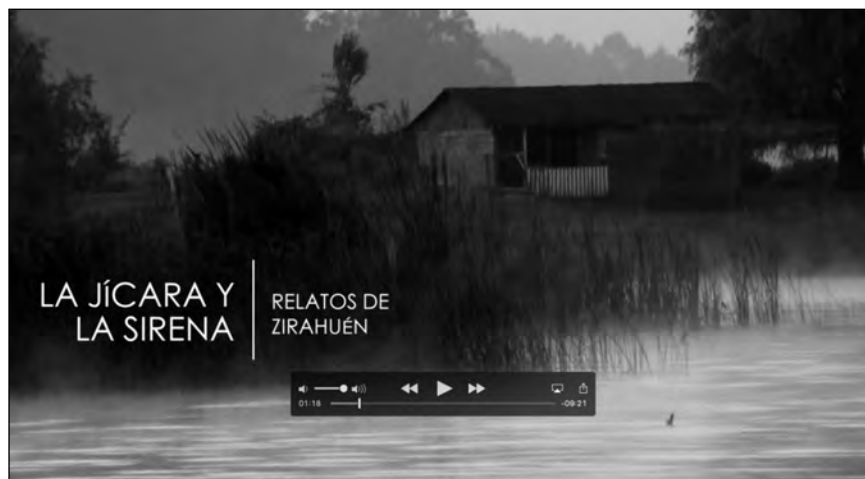
Imagen 7. Cortometraje La jícara y la sirena. Relatos de Zirahuén (LANMO, 2016).

El cortometraje es un montaje audiovisual y pretende, al igual que el corpus, llegar a un público diverso: especialistas y público en general. Con los fragmentos de las grabaciones de materiales orales y algunos de documentación de las fiestas y tomas sueltas de paisaje, se realizó una especie de collage audiovisual. El cortometraje La jícara y la sirena es una suerte de espejo de la realidad en el que se ponen en juego las distintas realizaciones culturales que completan el cuadro de vida del pueblo de Zirahuén en un lapso de diez minutos. En él aparece dibujada la poética que sirve como tejido articulador de las manifestaciones culturales y el papel central que desempeña el complejo cultural lago-mujer en Zirahuén. En la elaboración del montaje participaron el doctor Santiago Cortés Hernández y el cineasta Andrés Arroyo Vallín, técnico académico de video del LANMO.