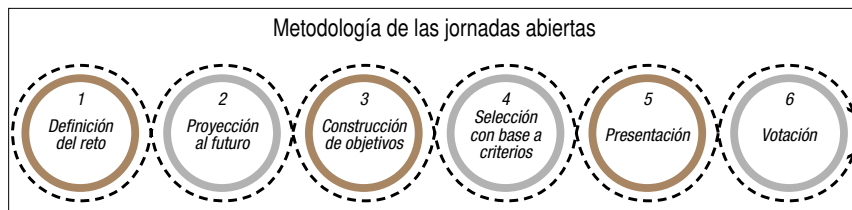
Figura 3. Esquema de trabajo de las jornadas abiertas

Para cada eje seleccionado, se llevó a cabo una jornada abierta en la que los participantes trabajaron juntos para definir objetivos de políticas públicas vinculados a la Agenda 2030 (IMCO, 2016) mediante el esquema mostrado en la Figura 3 .