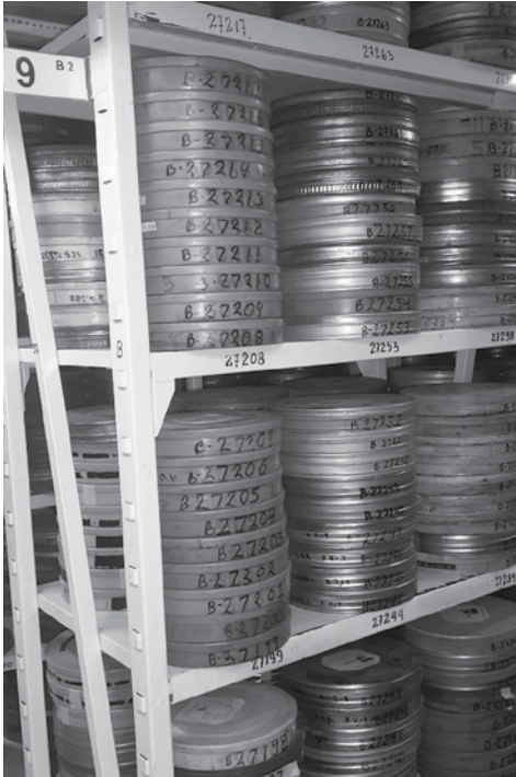
← Figura 1. Método de colocación secuencial de latas de películas