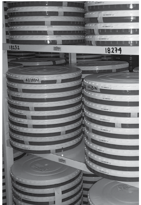
→ Figura 2. Método de ubicación por código de barras