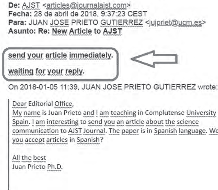
Imagen 2. Correo de revista depredadora