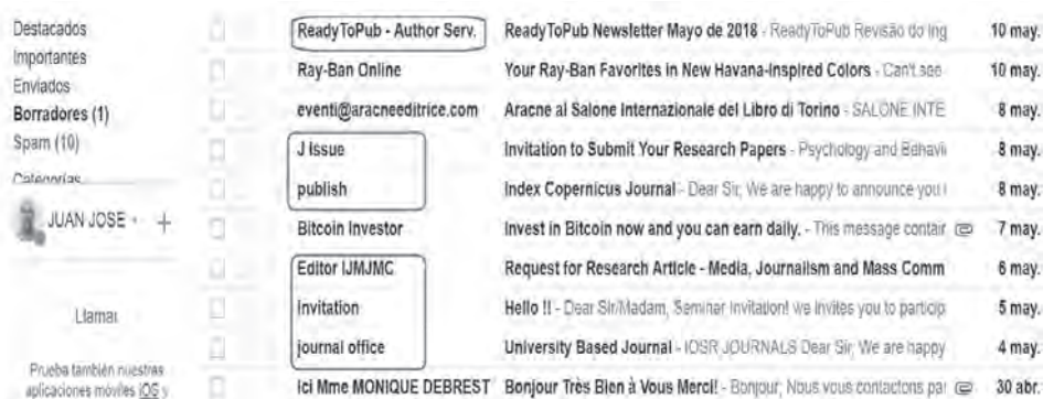
Imagen 1. Captación de revistas depredadoras

En la Imagen 1 , se muestran gran cantidad de invitaciones (hacia el autor del presente texto), alojadas en la carpeta Spam, por parte de diferentes revistas depredadoras buscando captar artículos. En pocos días del mes de mayo de 2018 se han recibido seis llamamientos para publicar.