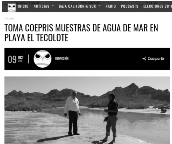
Figura 5. Video de evidencia donde se toman las muestras por parte de COEPRIS (Recuperado de http://elinformantebcs.mx/toma-coepris-muestras-agua-mar-playa-tecolote/ )