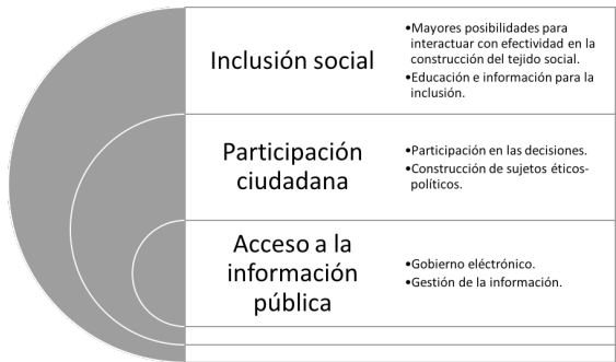
Ilustración 2. Relación entre acceso a la información, participación ciudadana e inclusión social