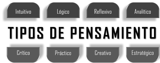
Figura 1. Tipos de pensamiento en los procesos formativos

Este método heurístico ha posibilitado desarrollar múltiples pensamientos para sus procesos formativos: