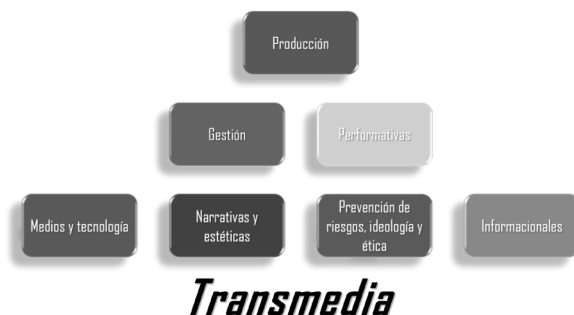
Figura 2. Competencias transmedia