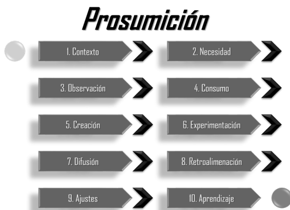
Figura 5. Procesos de prosumición en estudiantes universitarios