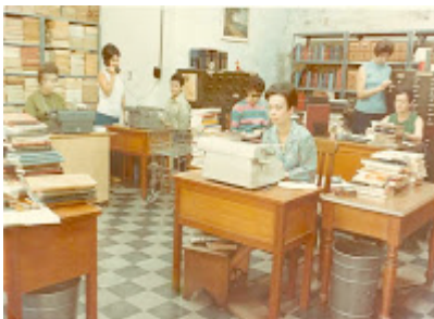
Figura 2. Departamento de catalogación y clasificación

A raíz de todas estas iniciativas, y con la creación del nuevo edificio de la Biblioteca Nacional en 1971, se dice que el Centro de Procesos Técnicos fue creado como centralizador de procesos cuando se le asignó personal para cubrir las bibliotecas Nacional y públicas.