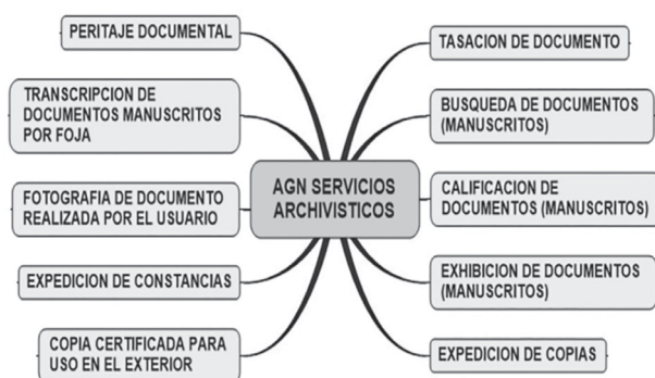
Figura 3: Servicios archivísticos AGN

A manera de ejemplo, sobre los servicios archivísticos podemos reconocer los que ofrece el Archivo General de la Nación, institución pública encargada de acopiar los bienes culturales y conservar el legado documental de la nación peruana, por estas características su función principal es la custodia, organización y tratamiento de los documentos. Los servicios archivísticos de la AGN se presentan en la siguiente figura: