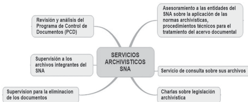
Figura 4. Servicios archivísticos del AGN para el Sistema Nacional de Archivos-SNA