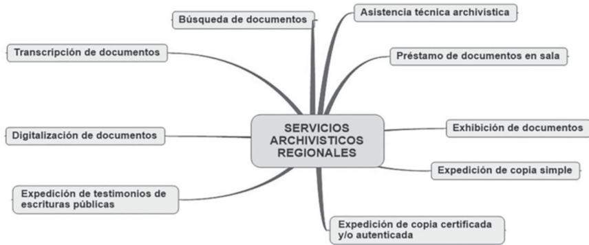
Figura 5. Servicios archivísticos de los archivos regionales