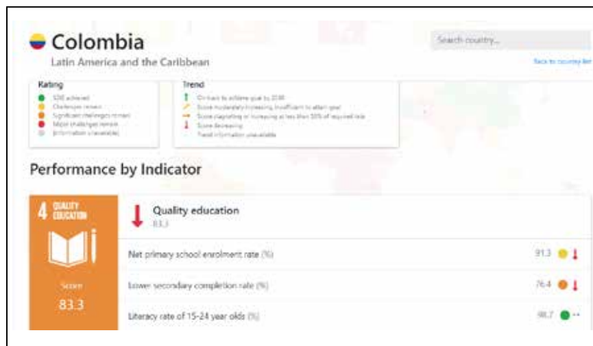
Imagen 1. Indicador de calidad de educación: Colombia

vienen generando en los territorios que requieren de manera urgente la intervención del gobierno para mejorar las condiciones e inversión económica en instituciones educativas públicas.