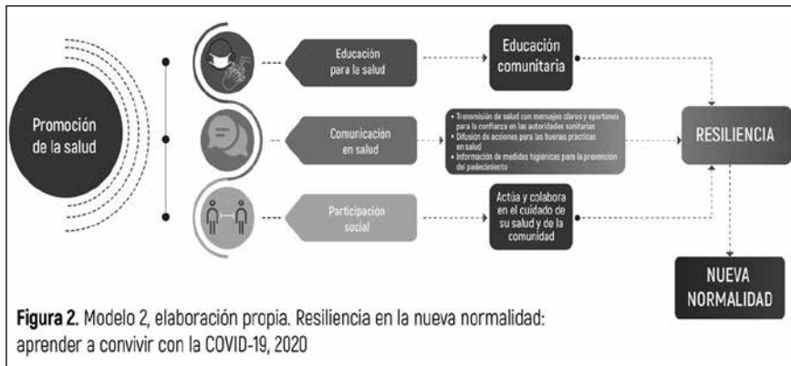
Figura 2. Modelo 2 - Resiliencia en la nueva normalidad: aprender a convivir con la covid-19

En el siguiente modelo de promoción de la salud, basado en tres pilares fundamentales y específicos ( Figura 2 ), se muestra un esquema para el caso que nos ocupa: