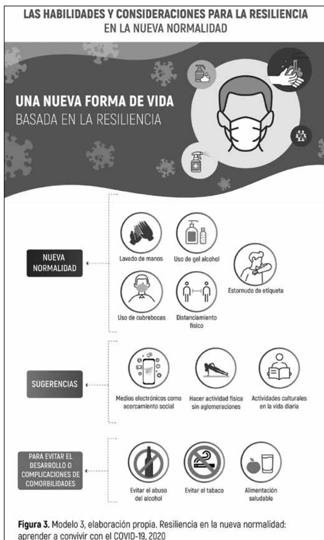
Figura 3. Modelo 3 - Resiliencia en la nueva normalidad: aprender a convivir con la covid-19