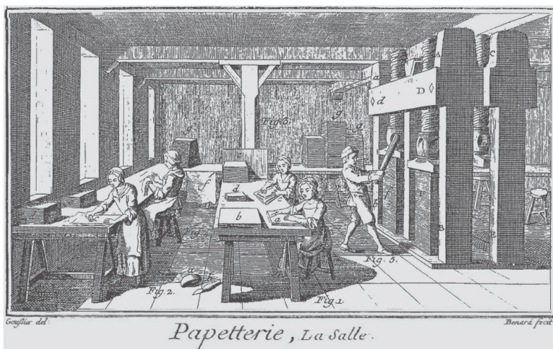
Figura 2. Papetterie, La Salle

Fuente: Diderot y d'Almbert (1751-1772, xiii), en https://bit.ly/2XybWjS .