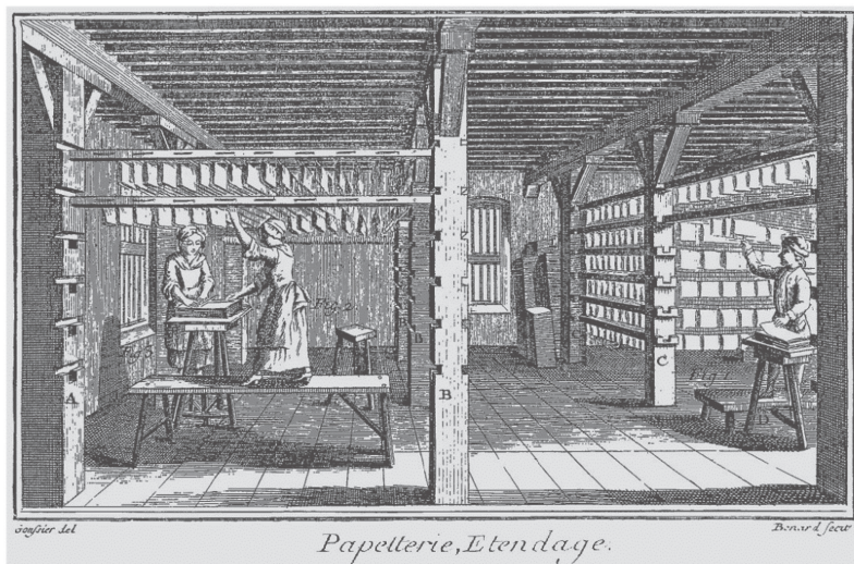
Figura 1. Papetterie, Etendage