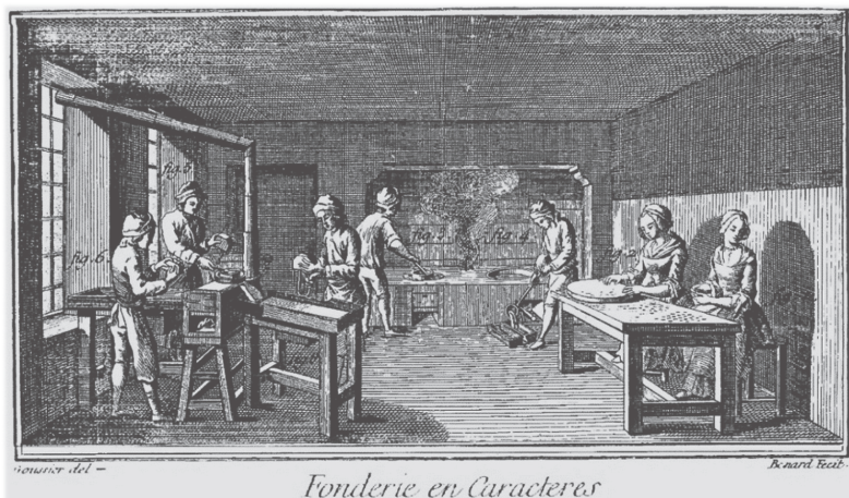
Figura 3. Fonderie en caracteres