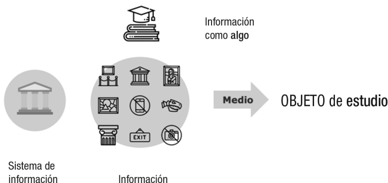
Ilustración 1. Interpretación del Sistema de Información.