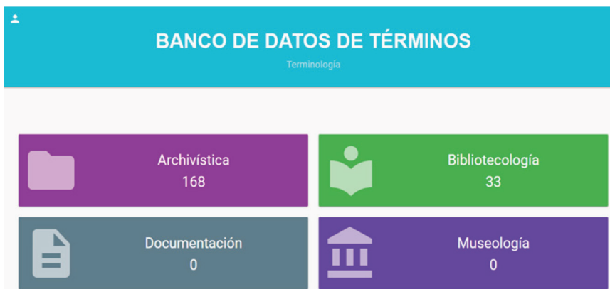
Figura 2. Imagen de la presentación de la página web del BDT-CI. http://bibliotecologia.udea.edu.co/terminologia/sitio/ .