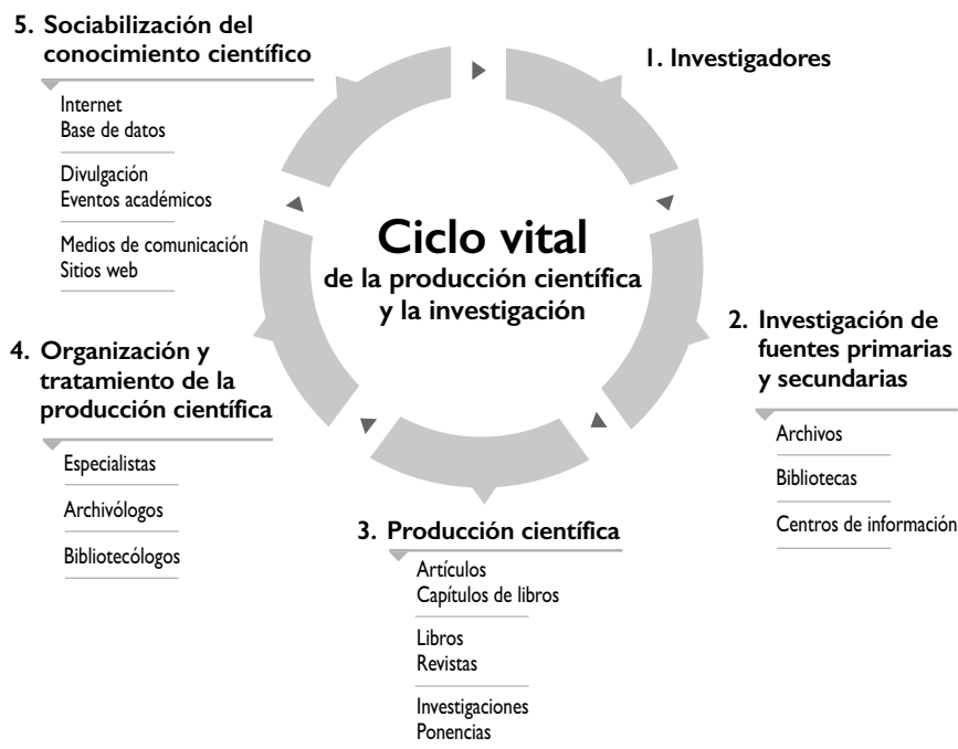
Figura 2. La importancia de la archivología en la investigación 11

En la figura 2 se observa el ciclo vital de la producción científica, donde la ciencia se materializa a través de los investigadores, debido a que los mismos necesitan de las fuentes de información primarias y secundarias que se encuentran en archivos, bibliotecas o centros de información para generar producción científica (artículos, capítulos de libros, libros, revistas, investigaciones, conferencias, ponencias, entre otras); sin embargo, toda producción debe ser organizada y tratada por especialistas de la información, en este caso archivólogos, bibliotecólogos o profesionales de la información, quienes difunden ese conocimiento a través de bases de datos, internet, divulgación en eventos académicos, medios de comunicación, redes y sitios web, entre otros.