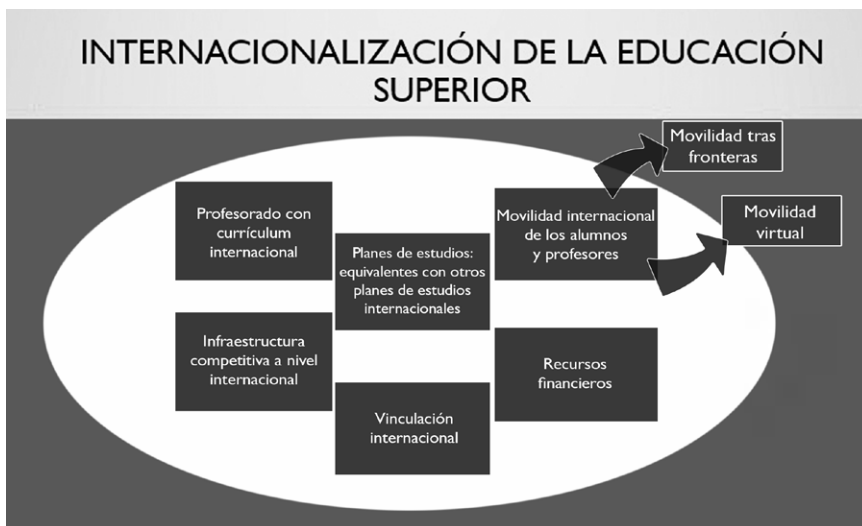
Figura 1. Elementos que conforman la internacionalización de la educación superior 2

Los elementos que se han considerado relevantes para que tenga lugar la internacionalización son: contar con un profesorado que cuente con un currículum internacional, planes de estudios competitivos, una infraestructura tecnológica, recursos financieros, la vinculación internacional y por supuesto la movilidad internacional académica que es de la que se va a enfocar el presente artículo.