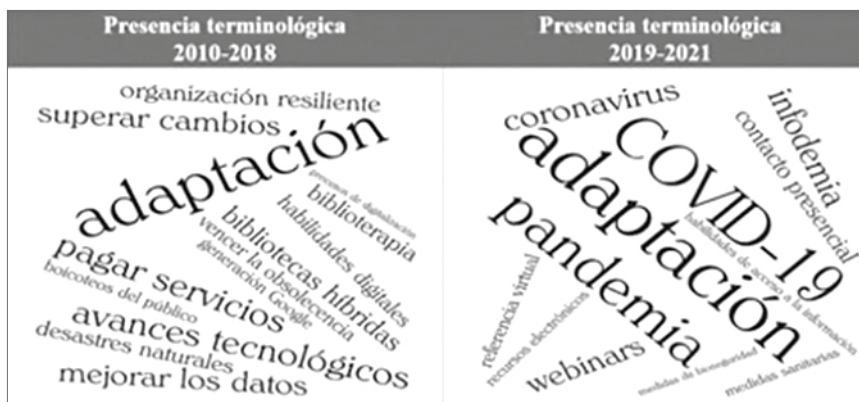
Figura 4. Tendencia terminológica en el CRB antes y después de la pandemia por COVID-19