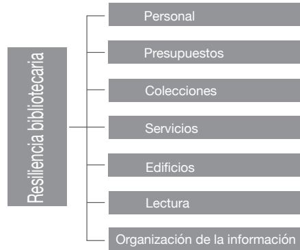
Figura 5. Elementos de la biblioteca que deben ser resilientes