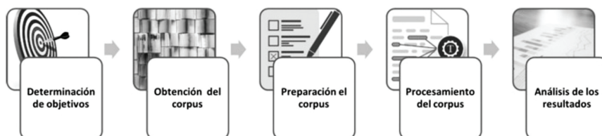
Figura 1. Etapas de la minería de texto

Desde el punto de vista procedimental, la minería de textos representa un proceso de extracción de información, formado por varias etapas. En la presente investigación, el proceso aplicado se constituye de las siguientes etapas ilustradas en la Figura 1 .