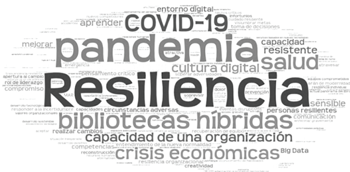
Figura 2. Elementos conceptuales asociados con la resiliencia en las bibliotecas

Una vez tratado el concepto de resiliencia, la investigación identificó los elementos que componen el núcleo temático de la resiliencia en el contexto bibliotecario. A partir del corpus procesado se detectaron 403 elementos conceptuales asociados con el término resiliencia ( Figura 2 ):