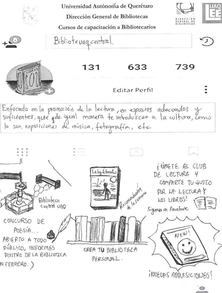
Anexo 4: actividad de realimentación