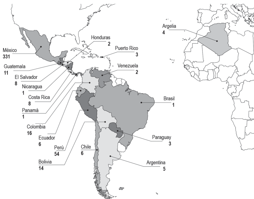
Figura 1. Asistentes registrados a sesiones virtuales por país de mayo 2020 a junio 2021

el artículo “Sesiones Virtuales como medio para la difusión de la Ciencia Abierta”. 6