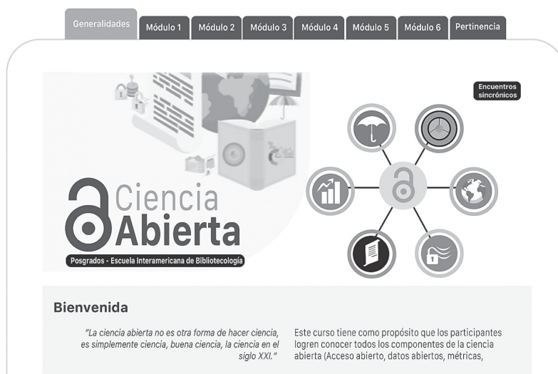
Figura 3. Seminario de Ciencia Abierta