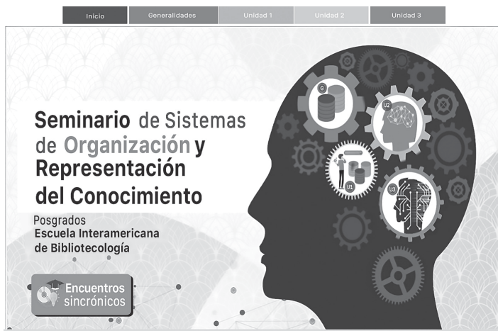
Figura 4. Seminario de Sistemas de Organización y Representación del conocimiento