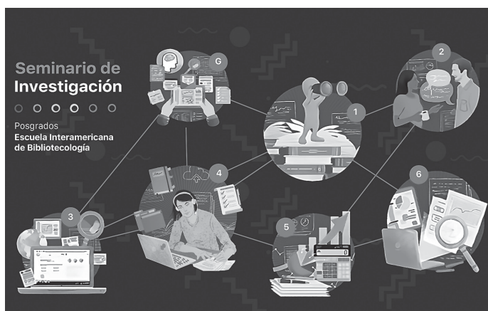
Figura 2. Seminario de Investigación