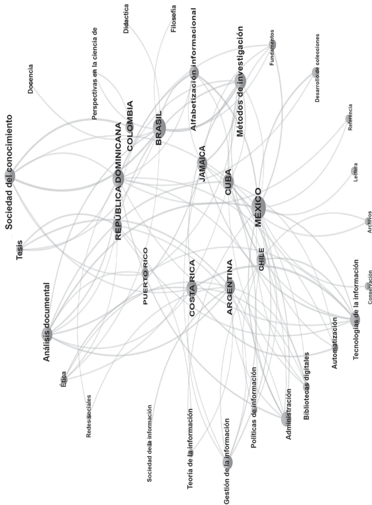
Figura 2. Representación de categorías y países