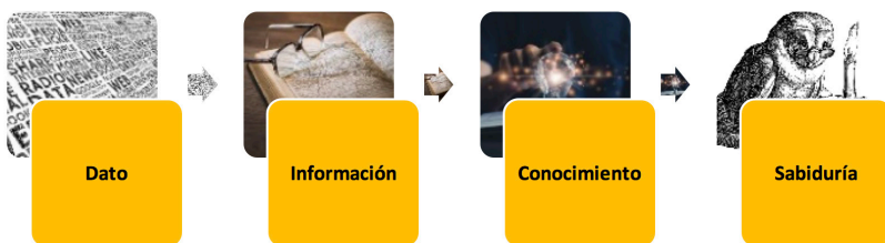
Figura 1. Cadena dato-información-conocimiento-sabiduría