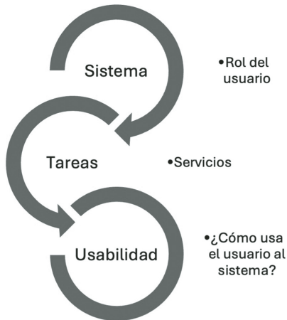
Imagen 1. Tareas del usuario

Entonces, podemos decir que las tareas del usuario son la consolidación del sistema de información que se ha definido en cada proceso del diseño del sistema, con base a la ingeniería de los requerimientos funcionales, según lo muestra la imagen 1.