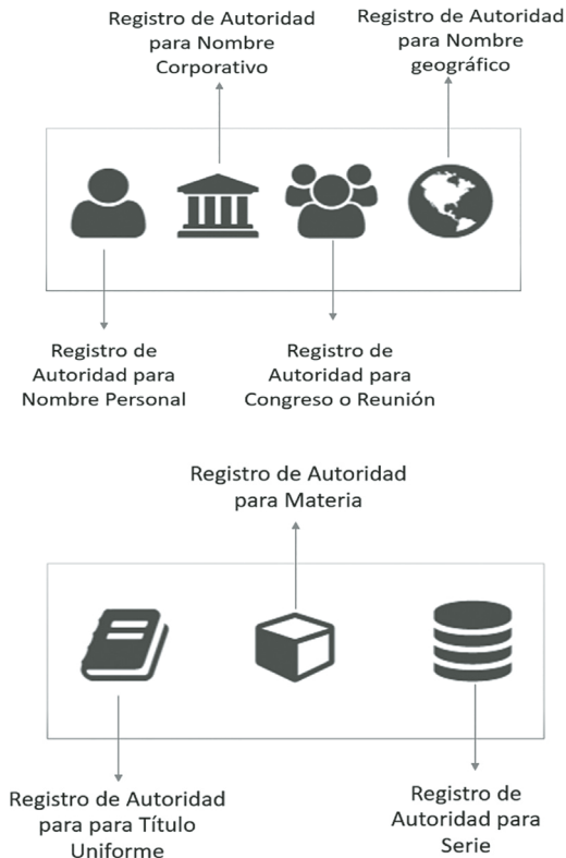
Imagen 4. Iconos que representan los formatos de autoridad