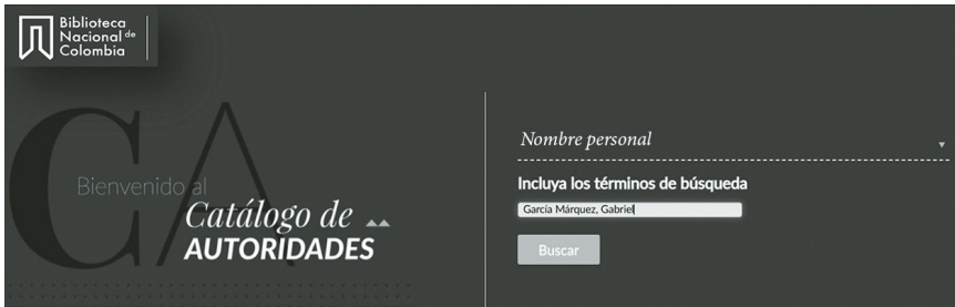
Imagen 1. Catálogo de autoridades de la Biblioteca Nacional de Colombia 1