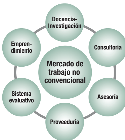
Figura 4. Mercado de trabajo no convencional del bibliotecólogo