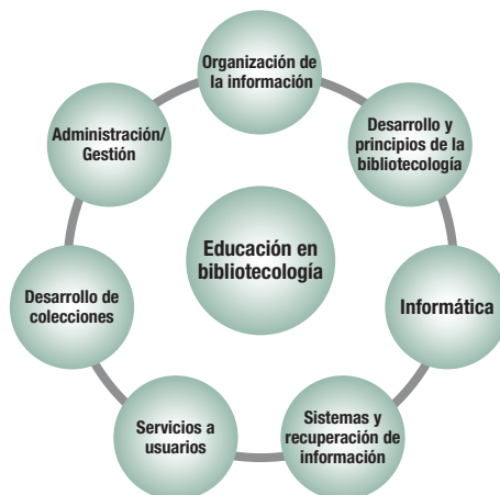
Figura 2. El campo de la bibliotecología

¿Qué debe saber el bibliotecólogo que egresa después de ocho semestres de formación? ¿Debe seguir lo que sugieren asociaciones extranjeras, como la guía para la investigación de ALISE 1 o los Lineamientos de la IFLA, 2 en los que no hay novedad alguna? ¿O sería mejor adoptar y adaptar los objetivos de desarrollo sostenible de la Agenda 2030 3 para relacionarlos con la situación del país? ¿O bien continuar con lluvias de ideas y ocurrencias?