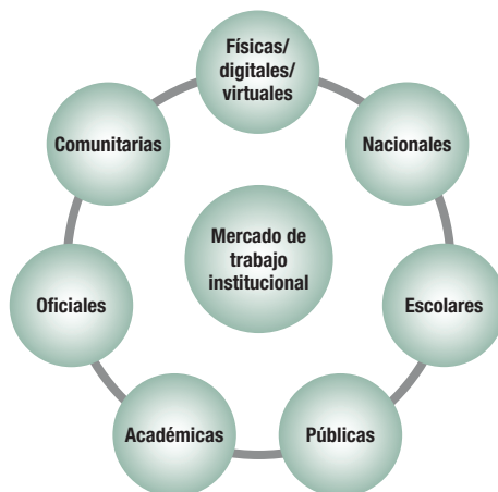
Figura 3. Mercado profesional del bibliotecólogo