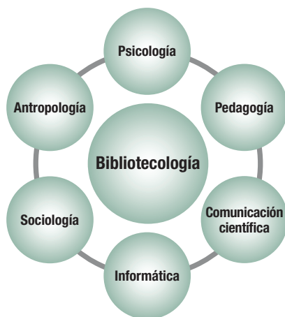
Figura 1. Disciplinas auxiliares de la bibliotecología

La bibliotecología requiere de la ciencia para su evolución, así como de los conocimientos de varias disciplinas que contribuyan a solucionar las múltiples situaciones que se presentan en el ejercicio profesional. Los estudios de usuarios, por mencionar sólo un caso, necesitan de los saberes de la antropología, la sociología, la psicología, la informática, la estadística ( Figura 1 ), entre otras, ya que, de lo contrario, no se podrán comprender los problemas, los resultados ni sus posibles soluciones.