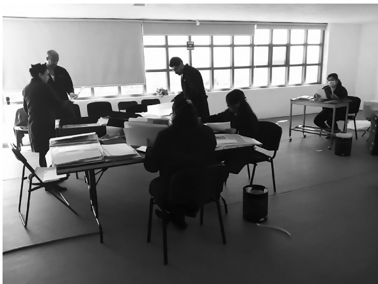
Fotografía 3. Línea de proceso documental

En contraste, el análisis documental de un fondo de artista o de patrimonio documental artístico no cuenta propiamente con un departamento de procesos técnicos o de catalogación. Por ello, se diseñan estrategias para realizar un inventario inicial cuando se adquiere un fondo documental de un artista plástico. Como gestores de la información, es necesario crear la infraestructura adecuada para desarrollar esta línea de procesos con personal cuya formación profesional proviene de otras áreas, ya que se trata de procesos de clasificación y catalogación que no se habían contemplado para materiales no librarios ( Fotografía 3 ).