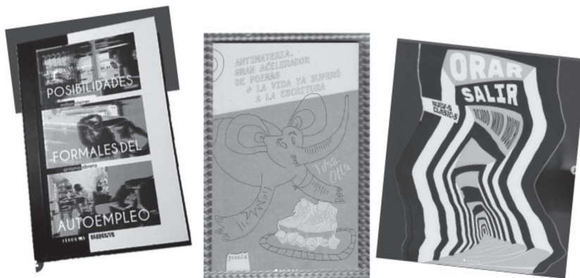
Figura 2. Portadas de libros representativos de las microeditoriales bolivianas Pequeño Elefante y Nuevos Clásicos