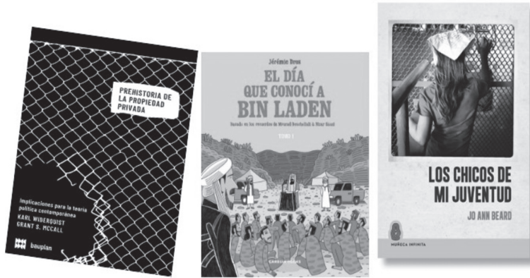
Figura 3. Portadas de libros representativos de las microeditoriales españolas Bauplan Books, Garbuix Books y Muñeca Infinita