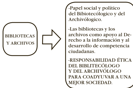
Fig. 1 papel social y político de los profesionales de la información

El bibliotecólogo y el archivólogo tienen una función en tal formación ( Fig. 1 ), para