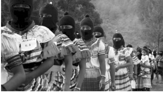
Imagen 7. Representación del movimiento zapatista desde la perspectiva femenina