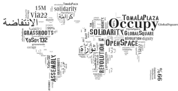
Imagen 2. "Otro mundo es posible", lema simbólico global del movimiento altermundista