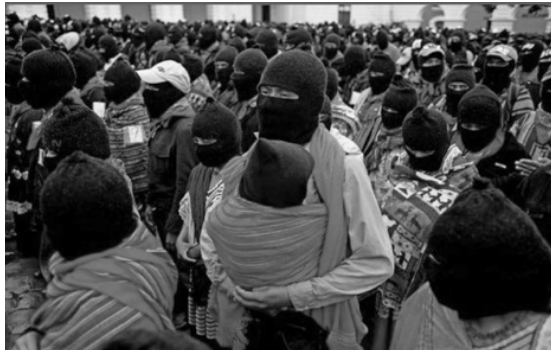
Imagen 5. Concentración magna del movimiento zapatista