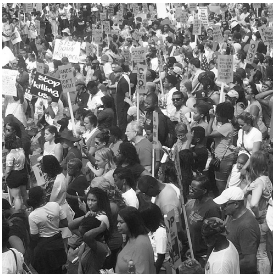
Imagen 9. Black Gay Lives Matter, que representa la lucha por los derechos humanos y civiles de las comunidades LGTBTTI en el marco del Movimiento Black Lives Matter