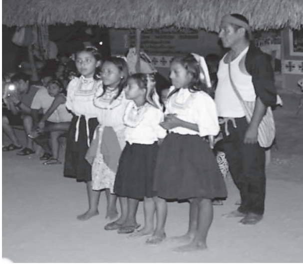
Foto 1. Danza típica