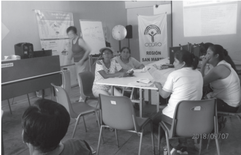
Foto 6. CEDRO Región San Martín