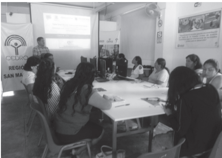
Foto 7. CEDRO Región San Martín