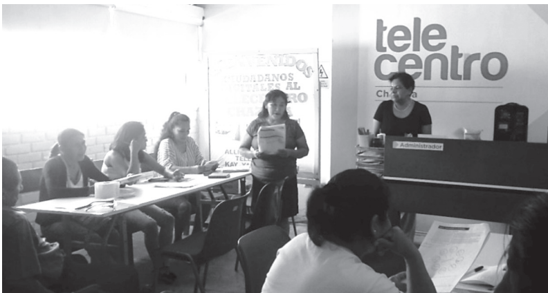
Foto 5. Telecentro