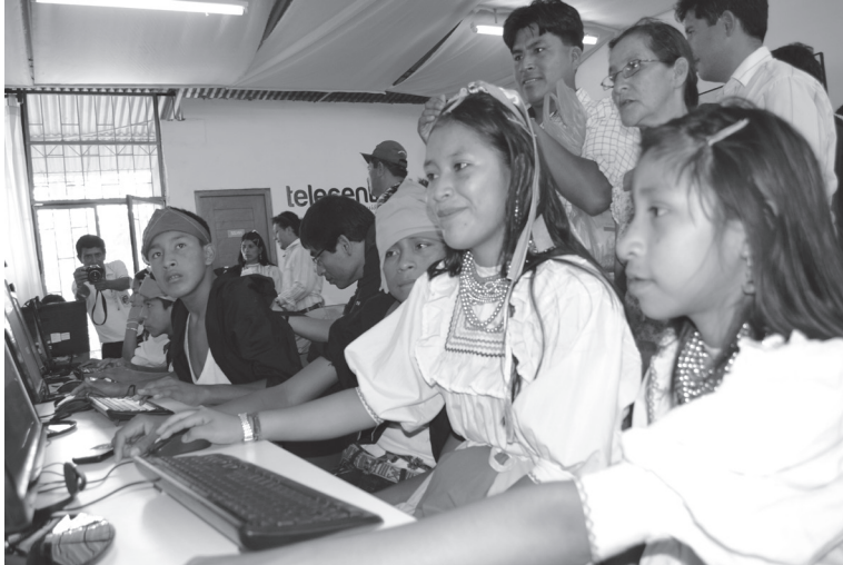
Foto 4. Telecentro

Información y comunicación: internet (telecentros CEDRO), redes sociales, alfabetización digital