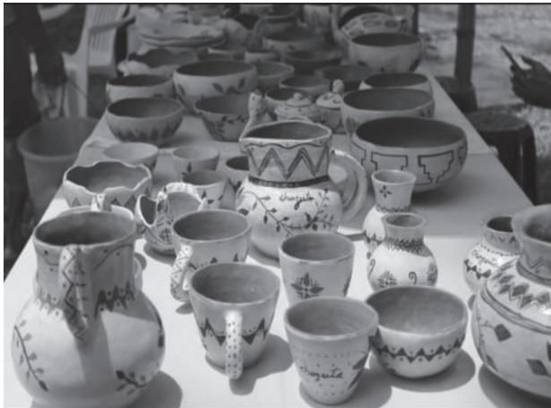
Foto 2. Cerámica