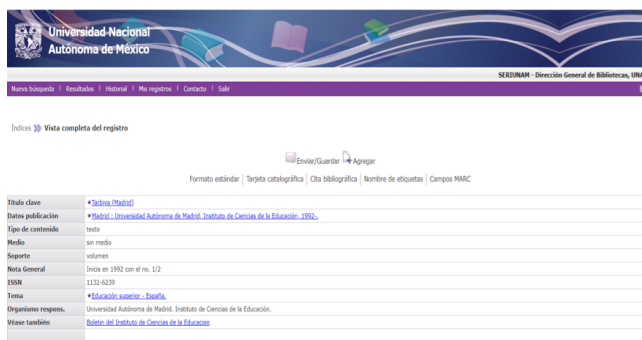
Figura 4. Título actual