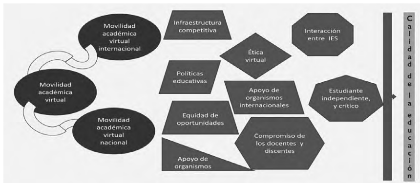
Figura 5. Modelo de movilidad académica virtual