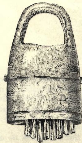
campana de Liberia

d. Forma de sonata: exposición de dos o más temas, su desarrollo y reexposición de los temas expuestos.