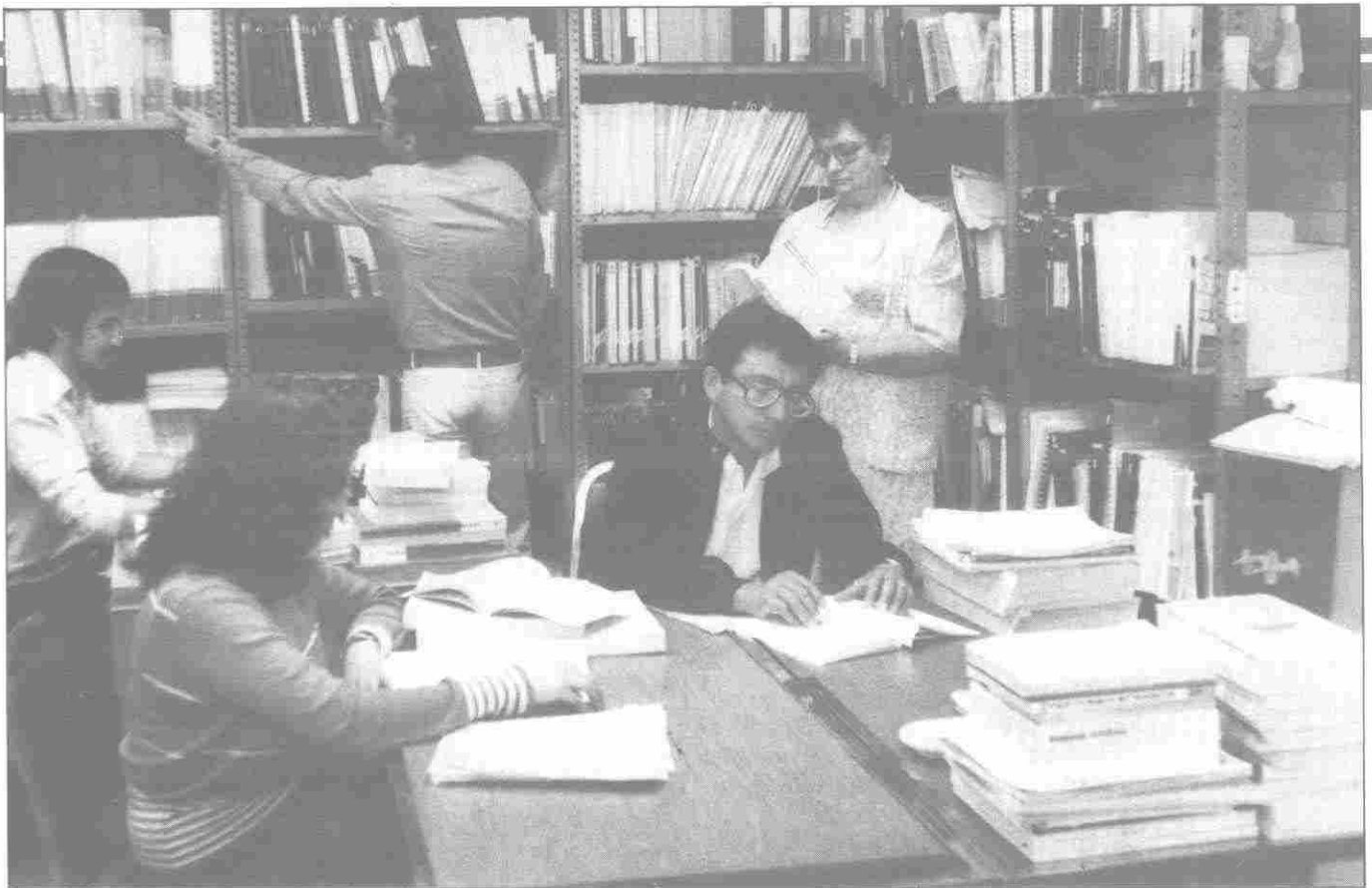
Consultando material bibliográfico.

Constitución Política), como los estudios de caso que proponen salidas para el desarrollo óptimo de algún problema concreto. Además ejemplificó que no sólo se recopilan proyectos de investigación nacionales, sino también internacionales, como en el caso de la ONU, que ha manifestado su interés por ayudar al sector social de la economía.