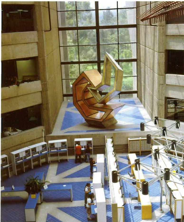
Interior de la Biblioteca Nacional ▼ Fotografía de Maribel Morales y Ernesto Peñaloza

Seminario de Cultura Literaria Novohispana. Con base en un sentido amplio de cultura literaria, los integrantes de este seminario estudian diversos aspectos y autores novohispanos desde hace varios años. Ha recibido aportes del Programa de Apoyo a Proyectos de Innovación e Investigación Tecnológica (PAPIIT), así como financiamiento del Conacyt, para llevar a cabo el proyecto "La literatura novohispana: rescate, estudio y edición de fuentes impresas y manuscritas" y elaborar una exhaustiva "Bibliohemerografía crítica de sor Juana Inés de la Cruz".