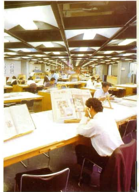
Sala de lectura de la Hemeroteca Nacional

El desarrollo de los programas mencionados permitirá al Instituto de Investigaciones Bibliográficas estar a la altura de sus circunstancias y cumplir con la parte de la misión que nuestra sociedad ha otorgado a la Biblioteca Nacional de México y a la Universidad Nacional Autónoma de México, instituciones que ratifican cotidianamente la acepción del adjetivo que las distingue en el comienzo del siglo XXI.