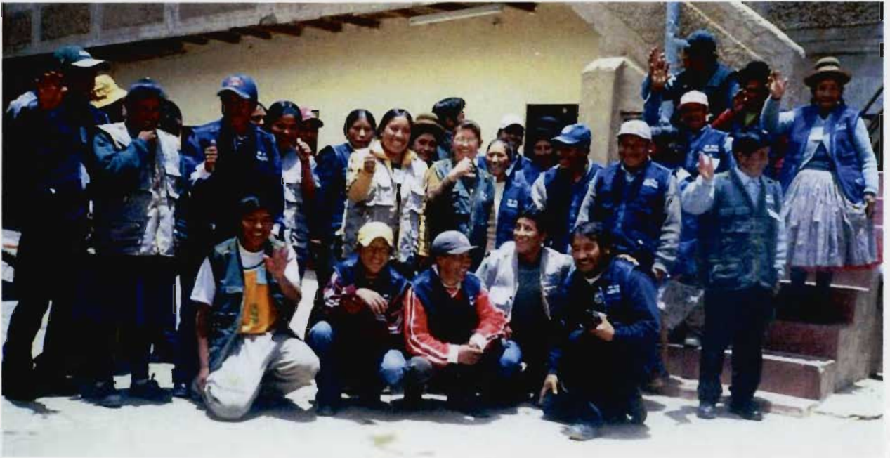
Reunidos el día final