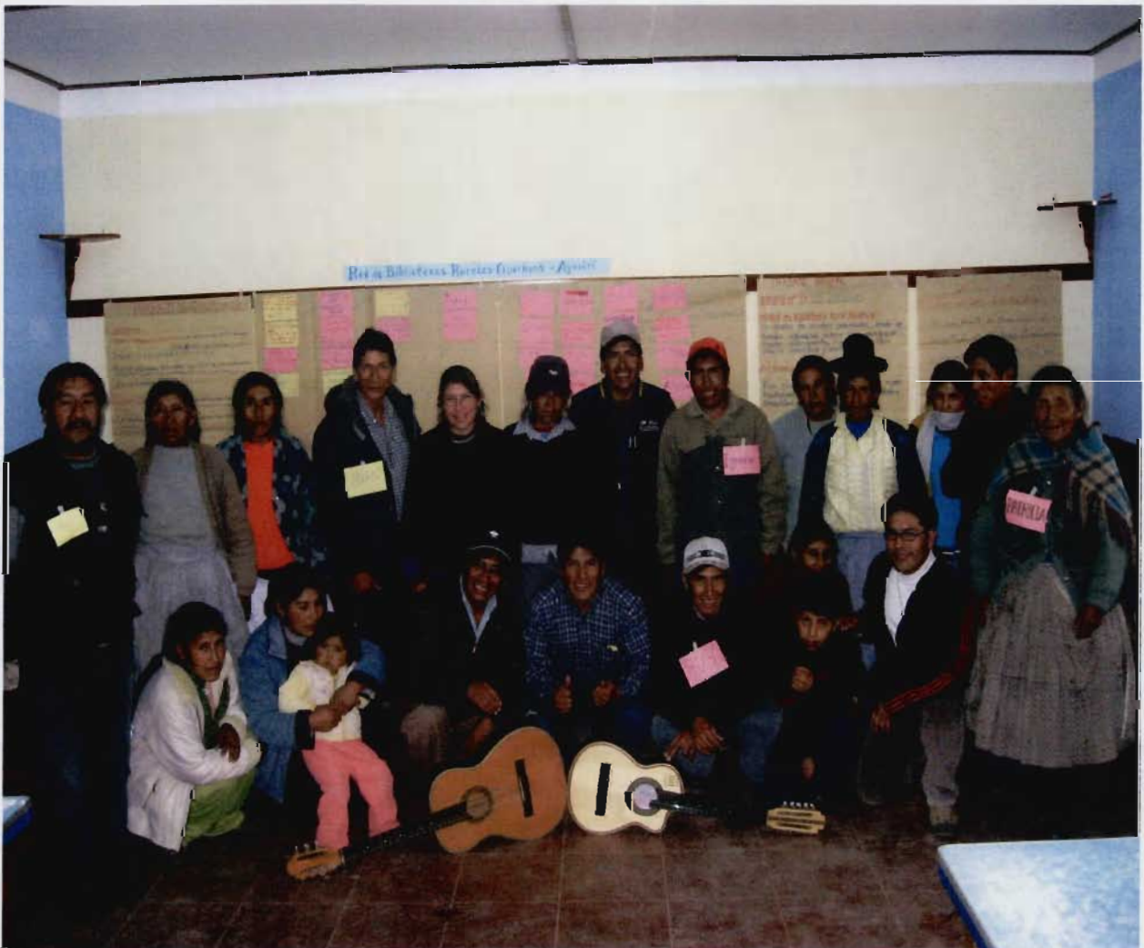
Ayaviri - Puno- Perú