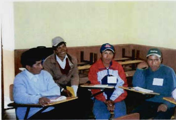
En pleno grupo focal de los varones