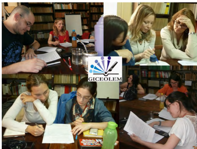
Figura 1. Revisiones colectivas durante reuniones del GICEOLEM

Los estudios que realiza el GICEOLEM parten de una pregunta común relativa a cómo la lectura y la escritura se trabajan en los distintos espacios curriculares. Nos interesa conocer de qué maneras escribir y leer como necesitan hacerlo los estudiantes (es decir, con fines de estudio) se incluyen en las materias. Inicialmente comenzamos indagando la educación superior pero luego también enfocamos la educación secundaria (alumnos de doce a diecisiete años). Nos proponemos aportar al debate acerca de dónde, cuándo, a cargo de quién, de qué manera, con qué fin y con qué fundamentación deben trabajarse la lectura y la escritura que se necesita que realicen los alumnos en la universidad, en la preparatoria, en la escuela previa, para aprender en las diversas asignaturas: en historia, en biología, en ciencia política, etcétera.