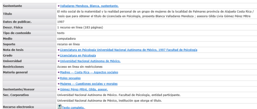
Figura 5. Registro bibliográfico en formato estándar, ejemplo con encabezamientos de materia