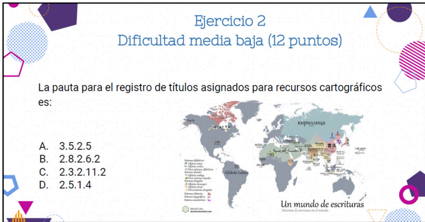
Imagen 11. Ejemplo de ejercicio de dificultad media baja