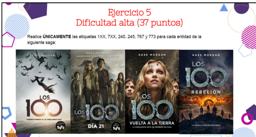
Imagen 12. Ejemplo adicional de ejercicio de dificultad alta