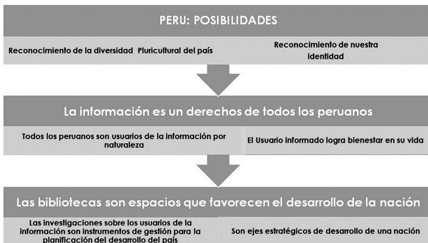
Figura 3. Bibliotecas impulsoras del cambio en el Perú

Teniendo en cuenta esas valoraciones, decimos, que los estudios de usuarios nos permiten el conocimiento de la persona, para proveerles la información que le permita un uso responsable y consciente de la misma.