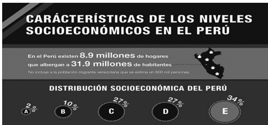
Figura 1. Características de los niveles socioeconómicos en el Perú