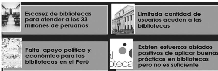
Figura 2. Problemas del desarrollo de las bibliotecas

Las cifras son más reveladoras, en el año 2018, la población de 14 años y más de edad asistió al menos una vez, en los últimos 12 meses, a algún servicio cultural según la región natural donde habitan; así tenemos que la visita a biblioteca y/o sala de lectura fue un total de 6.5% de pobladores, de esa cifra: costa 6.4%, sierra 7.7%, y selva 3.9%. 16