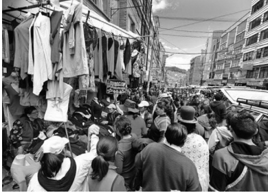
Imagen 1. Comerciantes informales antes de la cuarentena