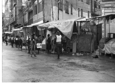
Imagen 2. Comerciantes informales durante de la cuarentena