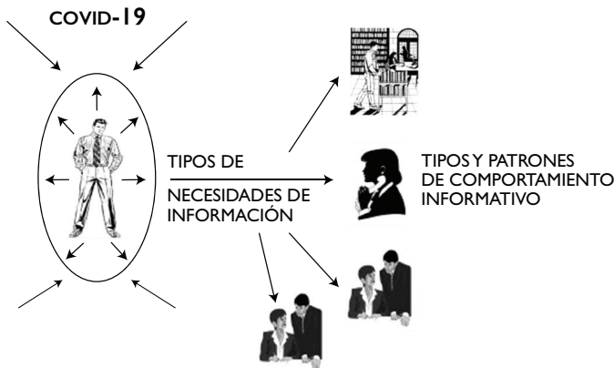
Figura 2. Impacto del COVID-19 en el ser humano y sus necesidades y comportamiento informativo

Se puede decir, de una manera especulativa ya que aún no contamos con estudios de usuarios llevados a cabo con rigurosidad, que la información que buscan los ciudadanos es de varios tipos según la comunidad en general que realiza la búsqueda.