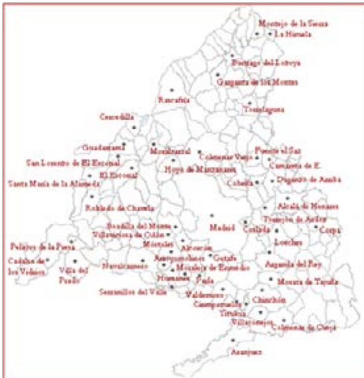
Imagen 2. Mapa de lugares de procedencia de los documentos editados

abandono (250), son textos escuetos, en ocasiones una sola palabra, que acompañaban a los niños que eran entregados por sus parientes a la inclusa; carecen en su mayoría de data, aunque los niños dejados en la institución procederían de las villas y aldeas cercanas a Madrid; también es elevado el número de documentos de la Villa, próximo a los doscientos. El objetivo es conseguir que en el corpus contenga el mayor número posible de textos editados y lograr que procedan de todos y cada uno de los municipios de la comunidad.